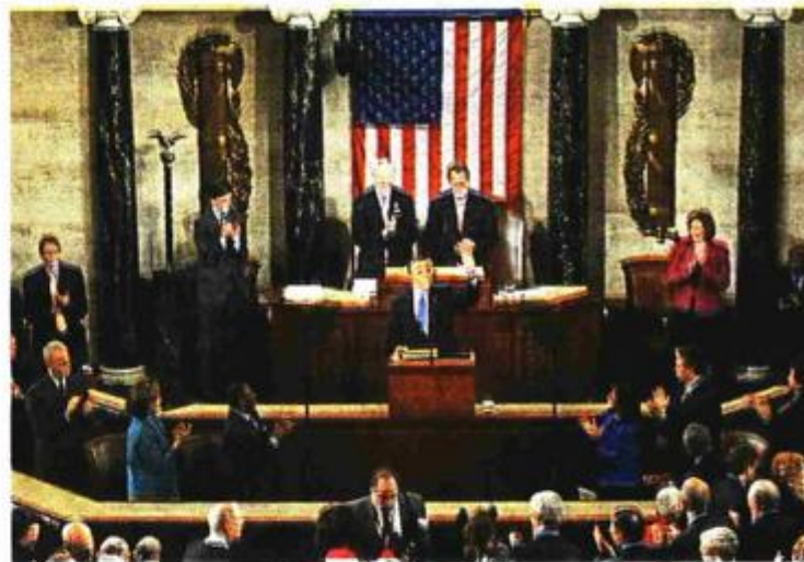
Skupina od 16 američkih kongresnika uputila je u proceduru novu rezoluciju o Bosni i Hercegovini

je i demokratski i republikanski kongresnici. Usto, nije nevažan podatak da je predlagač Turner i predsjednik Parlamentarne skupštine Sjevernoatlantskog saveza (NATO) i da je nedavno boravio u službenom posjetu BiH. Kongresnik iz Daytona je i ranije bio vrlo angažiran kada je u pitanju BiH i zahtjevi da se američka administracija aktivnije angažira u ovom dijelu svijeta. Iako se u predloženoj rezoluciji pohvaljuje napredak koji je ostvaren u BiH i pozivajući bh. vlasti na nastavak reformi, od međunarodne zajednice se zahtijeva da svoju predanost trajnom miru na Balkanu pokaže kroz organiziranje Dayton 2. Još jedna rezoluciju o BiH bila je jučer u središtu pozornosti, ali ovaj put europske diplomacije i politike. Pred Europskim parlamentom glasovalo se o rezoluciji o Daytonskom sporazumu, kao svojevrsnom načinu da ovaj parlament obilježi 20. obljetnicu potpisivanja mirovnog sporazuma koji je zaustavio rat u BiH i uspostavio nove odnose u zemlji i regiji. Različite političke grupacije u Europskom parlamentu lako su usuglasile konačan tekst rezolucije u kojem je naglasak stavljen na budućnost BiH, izgradnju