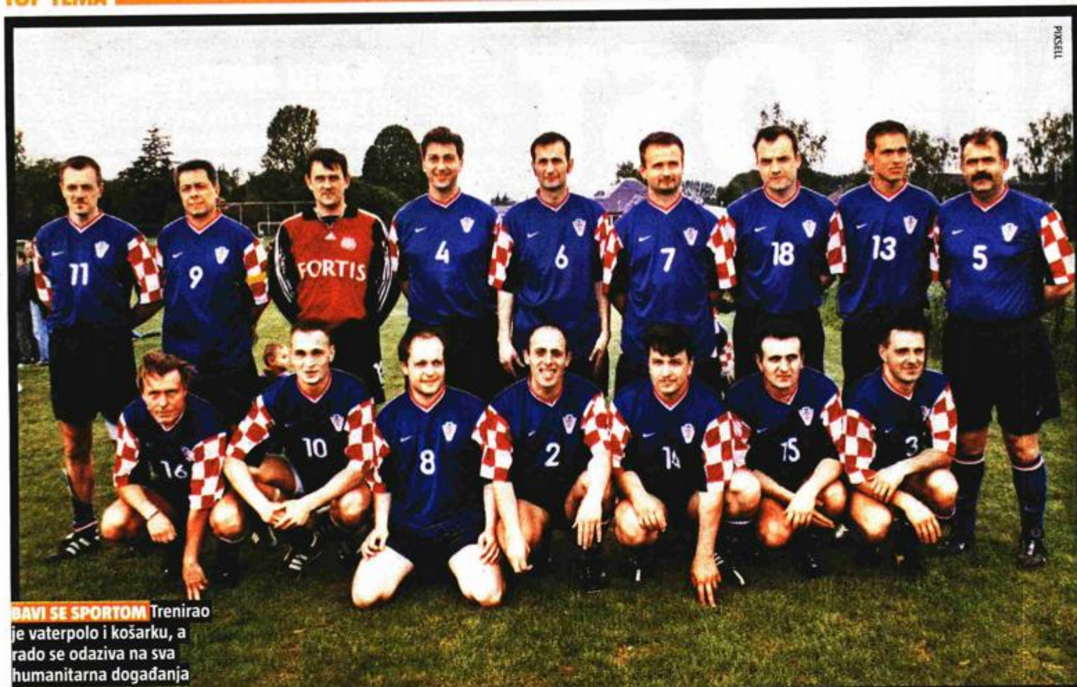
BAVI SE SPORTOM Trenirao je vaterpolo i košarku, a rado se odaziva na sva humanitarna događanja